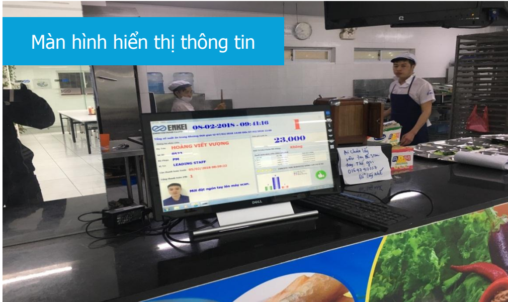
Màn hình hiển thị thông tin